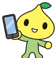
公式キャラクター ビットくん

右記二次元コードから「保険証券」の画像をアップロードして、スマホから簡単にお見積もりを依頼いただけます!