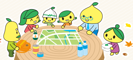
公式キャラクターピットくん・ピットくんファミリー