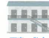
下宿の敷金 礼金・仕送り